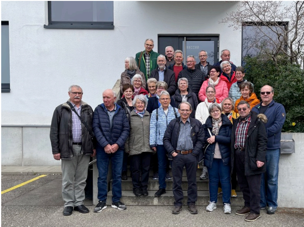
ein Teil der Gruppe