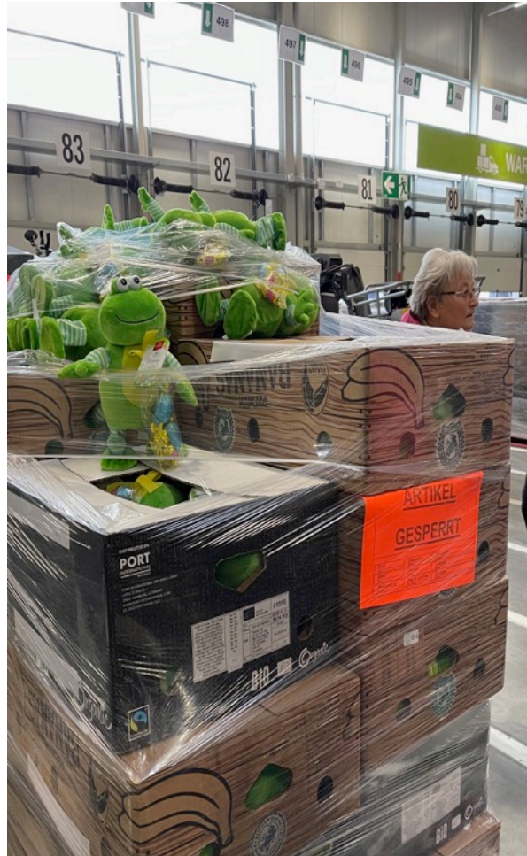
Zollkontrolle ist 4x jährlich im Lager . Was defekt ist geht retour, wie hier der Frosch. Die Augen fallen raus.